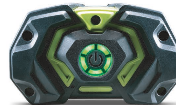
EGO'S UNIQUE ARC SHAPED DESIGN

Το σύστημα EGO Power+ παρέχει ισχύ που αντιστοιχεί στη βενζίνη χωρίς κανένα μειονέκτημα. Είναι απλούστερο, καθαρότερο, πιο ήσυχο και με λιγότερους κραδασμούς, είναι πιο άνετο στη χρήση. Το χαμηλότερο κόστος λειτουργίας και συντήρησης σημαίνει ότι η μετάβαση στο EGO Power+ θα οδηγήσει σε μακροπρόθεσμη εξοικονόμηση. Επιπλέον, με μηδενικές εκπομπές κατά τη χρήση, μπορείτε να κάνετε το ελάχιστο για να μειώσετε τις επιπτώσεις σας στο περιβάλλον.